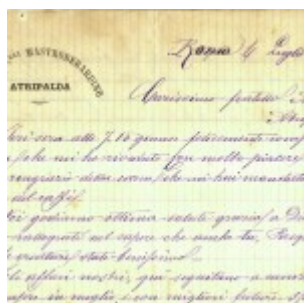
lettera da Giuseppe a Angelo 4 luglio 1886 - 1 bis