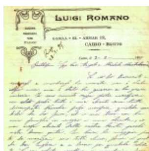
lettera da rist. del Cairo - Egitto - 3 febbraio 1915