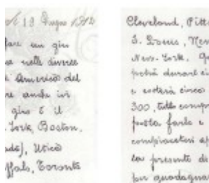
estratto lettera 1912 da NY