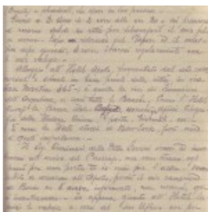
lettera Michele al fratello Angelo da B Aires 6-7 febbraio 1921 - 1