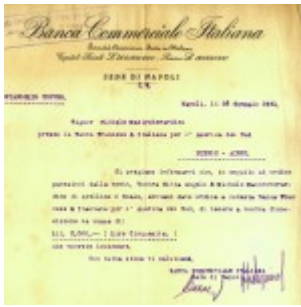
Banca Commerciale Italiana 26 gennaio 1921 provvista fondi bis